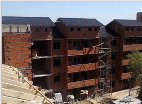
LAS FLORES II LAS FLORES - PROV. DE BUENOS AIRES ESTADO / en obra