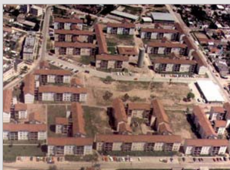
BARRIO 592 VIVIENDAS ZÁRATE - PROV. DE BUENOS AIRES ESTADO / finalizado