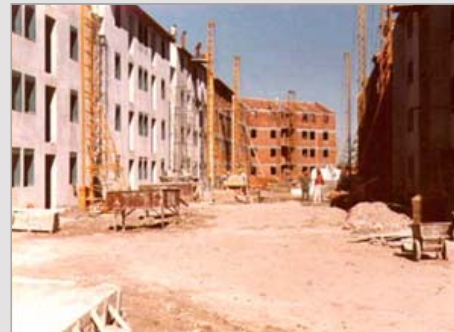
BARRIO 598 VIVIENDAS ENSENADA - PROV. DE BUENOS AIRES ESTADO / finalizado