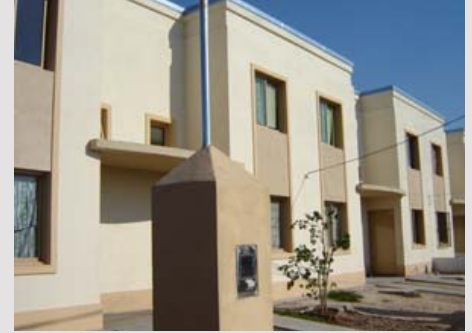
CAVA CHICA BECCAR, PARTIDO DE SAN ISIDRO ESTADO / finalizado