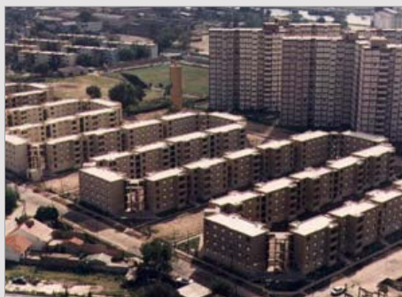
BARRIO DE 400 VIVIENDAS AVELLANEDA, PROV. DE BUENOS AIRES ESTADO / finalizado