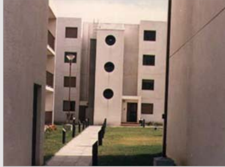
CONSTRUCCIONES DE VIVIENDA PARA LA ARMADA MARTINEZ - PROV. DE BUENOS AIRES ESTADO / finalizado