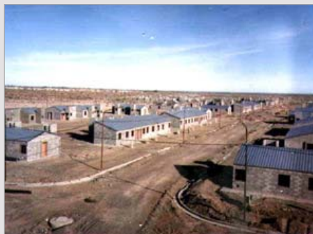
BARRIO DE 490 VIVIENDAS RAWSON - CHUBUT ESTADO / finalizado