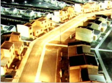
BARRIO 297 VIVIENDAS SAN NICOLAS, PROV. DE BUENOS AIRES ESTADO / finalizado