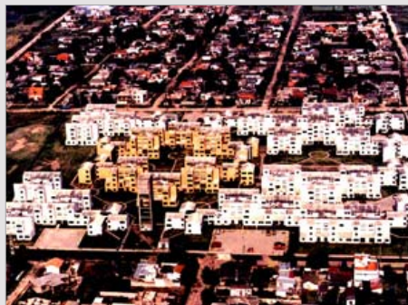
BARRIO DE 448 VIVIENDAS QUILMES, PROV. DE BUENOS AIRES ESTADO / finalizado