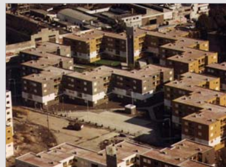
BARRIO 816 VIVIENDAS AUTOPISTA AU 27 - C.A.B.A ESTADO / finalizado