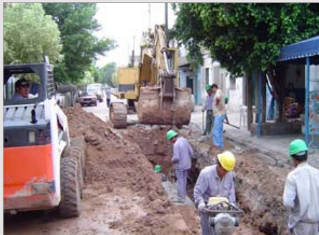
LAS FLORES I LAS FLORES - PROV. DE BUENOS AIRES ESTADO / finalizado