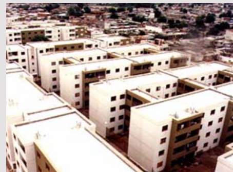
BARRIO DE 528 VIVIENDAS Av. De la Riestra – C.A.B.A. ESTADO / en obra